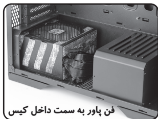
فن پاور به سمت داخل کیس