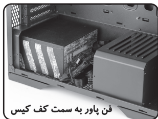
فن پاور به سمت کف کیس