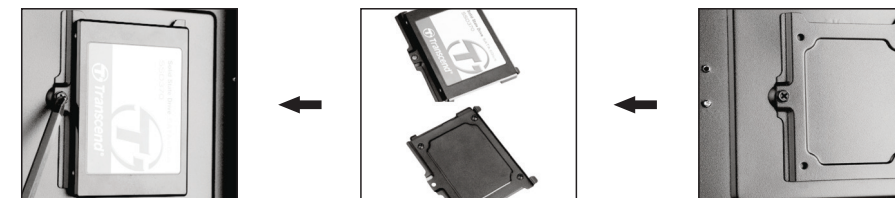
1- براکت فلزی 2.5" پشت سینی مادربرد خود محکم شده است را باز نمایید. 2- براکت فلزی 2.5" که توسط یک پیچ در جای خود محکم شده است را باز نمایید. 3- پس از نصب درایو 2.5"، براکت را در جای خود قرار داده و به سینی کیس پیچ کنید.