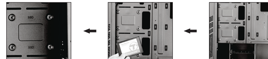
1- محل نصب حافظه های 2.5" مورد نظر قرار دهید. 2- حافظه های 2.5" خود را در جای خود قرار دهید. 3- توسط 4 عدد پیچ مخصوص درایو را به محل مورد نظر متصل نمایید.