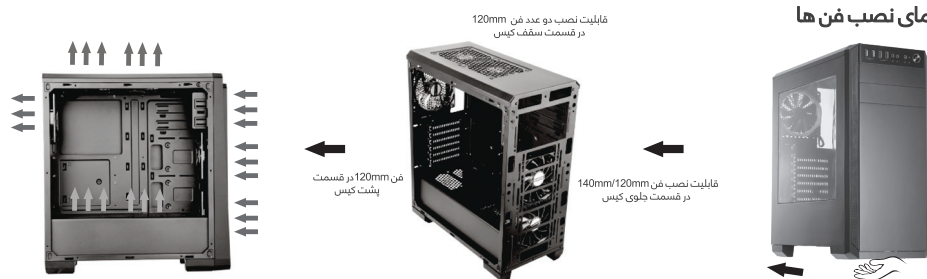
قابلیت نصب دو عدد فن 120mm در قسمت سقف کیس قابلیت نصب فن 140mm/120mm در قسمت جلوی کیس فن های نصب شده - قابل نصب