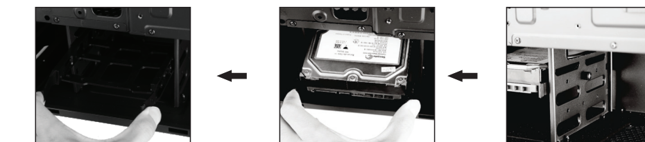
1- همانند تصویر، براکت های پلاستیکی را از درون محفظه هارد خارج نمایید. 2- تجهیزات ذخیره سازی 3.5" را درون محفظه پلاستیکی قرار دهید. 3- جهت جلوگیری از لرزش هاردیسک، براکت را به بدنه کیس پیچ کنید.