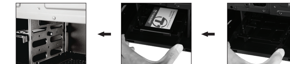
1- ابتدا همانند تصویر، براکت های پلاستیکی را از درون محفظه هارد خارج نمایید. 2- تجهیزات ذخیره سازی 2.5" را توسط 4 عدد پیچ به کف براکت پلاستیکی پیچ نمایید. 3- جهت جلوگیری از لرزش هاردیسک، همانند تصویر بالا براکت را به بدنه کیس پیچ کنید.