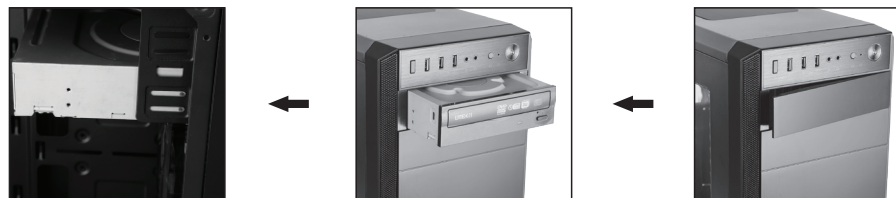
1- ابتدا گیره درپوش درایو نوری را به سمت بیرون بکشید و جدا نمایید. 2- درایو نوری را همانند تصویر بالا درون محفظه تعیین شده قرار دهید. 3- توسط پیچ های مخصوص آن را محکم به دو طرف بدنه کیس ببندید.